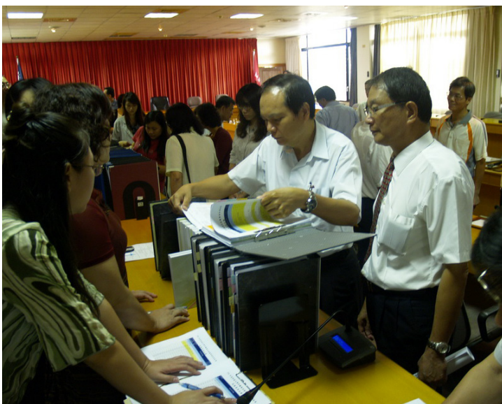
●評鑑委員查證資料

綜上，我國高等教育在這波全球化與國際化的浪潮下，必須能夠提升品質、確保績效、尋找自我的定位及發展獨特的優勢，方能在國際的舞台上站穩腳步並邁向優質，而大學評鑑工作在如此的過程中扮演了極其重要的角色。透過評鑑工作系統、科學的規劃、執行與檢討，我國高等教育之評鑑工作才能逐步進入軌道，希冀我國高等教育評鑑能在國人重視、學校積極參與、政府有效施為以及健全評鑑制度的多方配合下，促使我國大學達成品質保證與績效責任的願景。