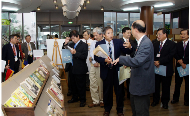
●評鑑委員參觀圖書館

略方向為：調整大學評鑑指標，促進大學多元發展，不同類型之大學，有不同的評鑑指標，由各大學依自我發展特色自訂評鑑項目與指標來發展各自多元的特色；建立多元評鑑管道接軌國際，提升國內評鑑機構水準擴大評鑑效益；整合各類訪視、績效考核與評鑑，減輕大學的負擔。細節說明如下：