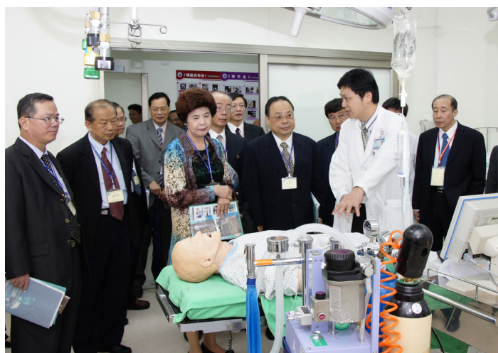
●評鑑委員參觀學校臨床技能教室

其實，整個評鑑機制對教育部及學校而言，正面效益仍大。因為透過此一機制，學校可以提升整個教學品質，而教育部也可以看到大學的整體辦學績效，並了解各大學對教育部政策的看