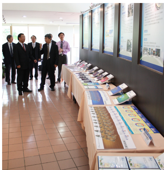
●接受訪視學校進行說明

學校績效責任主要包括校務整體表現及學生學習成效。校務整體表現是依學校發展目標與定位，評核學校學術與專業表現，並從評核機制中探究校務經營問題，提出改善行動，以確保校務發展目標能符合社會期待。學生學習