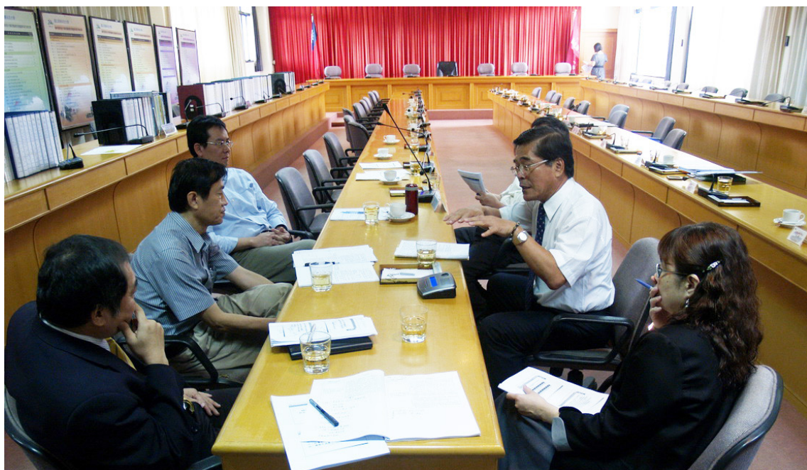
●辦理校務自我評鑑校長與委員晤談

民國 94 年 12 月，高等教育評鑑中心基金會正式成立，第 2 年辦理大學系所評鑑，對於評鑑改善成效不佳者，即給予減招或停招處分，使得各大學面臨更大的改善壓力；民國 96 年，教育部訂定「大學評鑑辦法」，將評鑑結果與大學系所調整、招生名額、學雜費及經費補助相連結，使結果更具強制性。