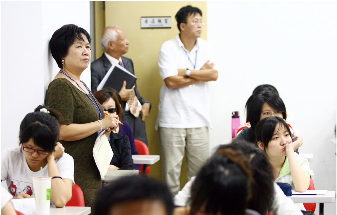
●評鑑委員了解學生上課情形

評鑑機制對教育部及學校而言，具有極大的正面效益。因為透過此一機制，學校可以提升教學品質，而教育部也可以了解各大專校院整體辦學績效，並了解各大學對教育部政策的看法，可以做為未來制定教育政策的參考。