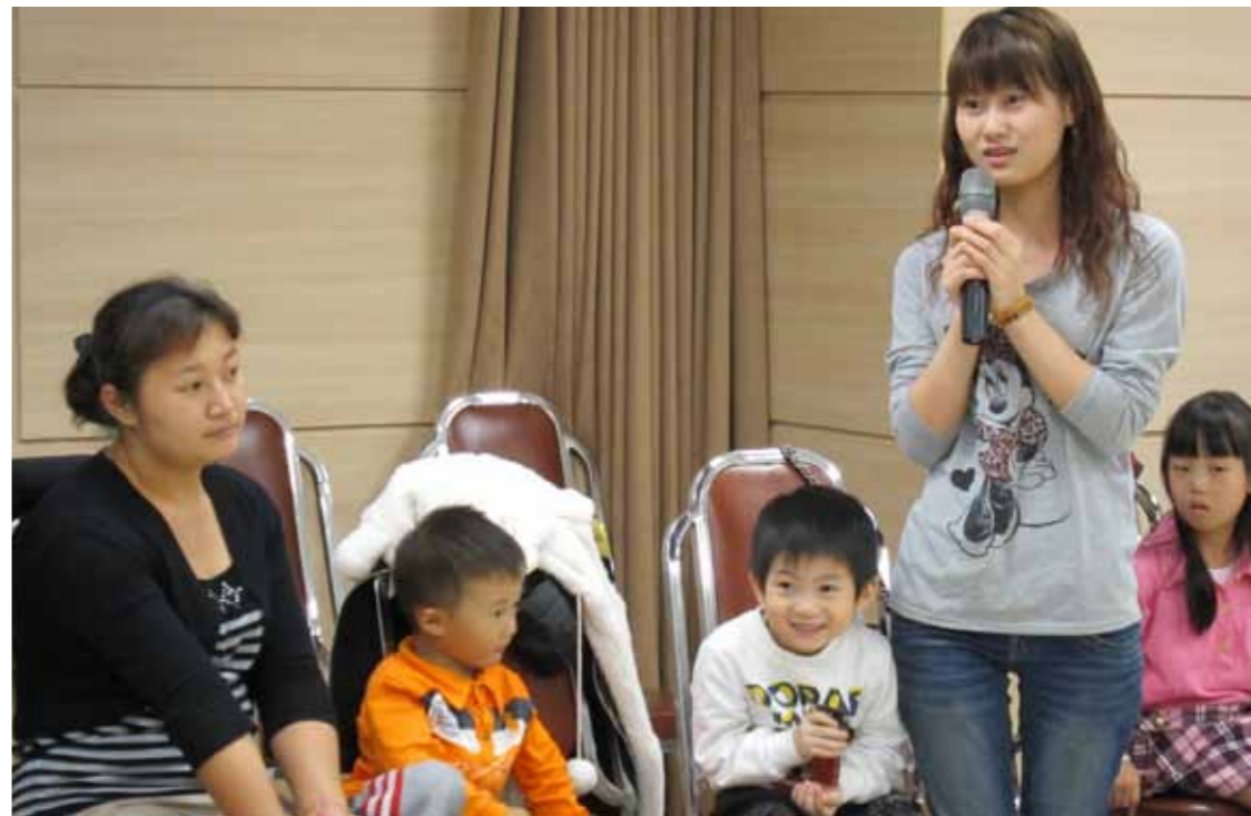
●陸配在臺灣無法發揮職業才能，對個人不公平，也是社會的損失

這次招收大陸專科生的試辦，有一些學校並沒有提出申請，教育部探明其原委發現，沒有提出申請的學校認為陸生或境外生名額不多，並不想投入招生成本，說明各校的考量不盡相同，對學校而言是多一條可以選擇的路。能夠吸引更多陸生來臺就學，除了讓技職校院的教育資源得以充分發揮價值外，還可協助臺商培育務實致用的人才，同時促進兩岸技職教育交流。