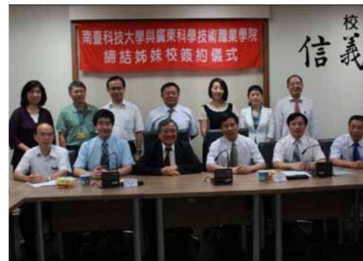
●擴大採認學歷，有助於有助擴大兩岸校際之間的交流

據聯合國教科文組織統計，98 年大陸地區共有 51 萬 0,314 名海外留學生，留學生人數居世界首位。另查 99 年大陸地區共有 1,246 所專科學校，畢業生 332 萬餘人，較大學本科