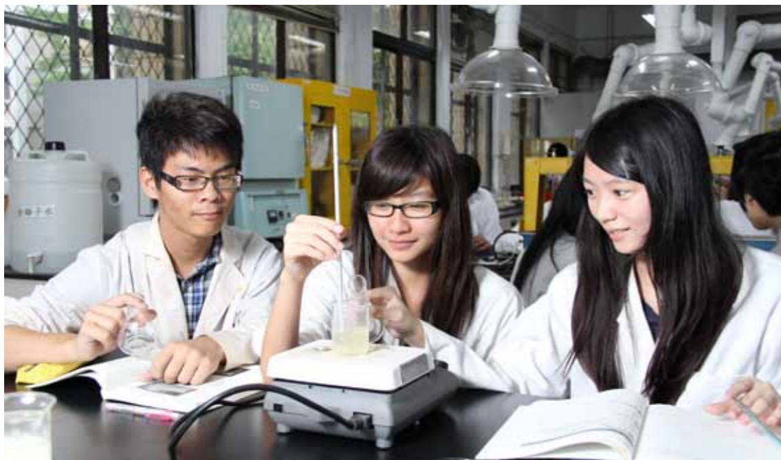
●臺灣技職院校的特色重實務、技能，對大陸專科生而言更易銜接