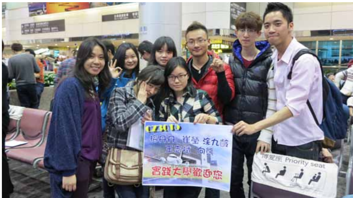
●臺灣技職院校的特色重實務、技能，對大陸專科生而言更易銜接