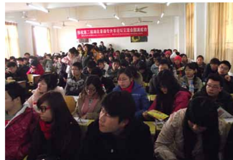
●大陸沒有二技學制，再進修只能插大，但管控專升本人數每年只批准 5%，競爭非常激烈

再以目前大陸人士報考臺灣各大學的碩、博士及學位學士班為例，碩、博士班報考條件，僅以符合教育部認可學校的學歷為報考條件，並沒有自我設限考生，必須參加大陸每年考試院 1 月份所舉辦的碩、博士入學考試取得成績者始得報名。其次，目前大陸 985 和 211 工程符合教育部認可的學校，同時，也可以依法來辦理兩校間雙聯學制上的合作，政府充分的維繫了「學歷採認辦法」的自主與尊嚴性。再則，報考學士學位班的陸生，其報考條件為