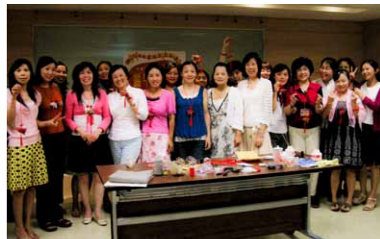
●採認大陸專科學歷，有利於保障陸籍配偶的基本就學人權

歷自 99 年開放採認以來，仍有限校、限領域等限制；雖目前擴大開放大學校數與專科學歷，但就整體比例與國際趨勢而言，仍有許多改善的空間。未來如兩岸學術交流與招生等無不對等之情形，政府宜再擴大開放採認範圍，俾利改善制度、提昇我國高等教育競爭力。