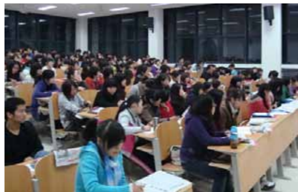
●今年首度試辦大陸專科生赴臺讀二技，但因時程太晚，僅有 200 多位申請

1. 102 年大陸人士可報考臺灣各大學研究所碩、博士的考生，其條件為設籍北京、上海、浙江、江蘇、福建、廣東、湖北及遼寧 8 省市，並符合教育部認可的學校學歷者；報考學士學位班的陸生，除上述大陸政府所設限的 8 省市設籍，其報考條件則為參加當年度 8 省市高考取得成績者。