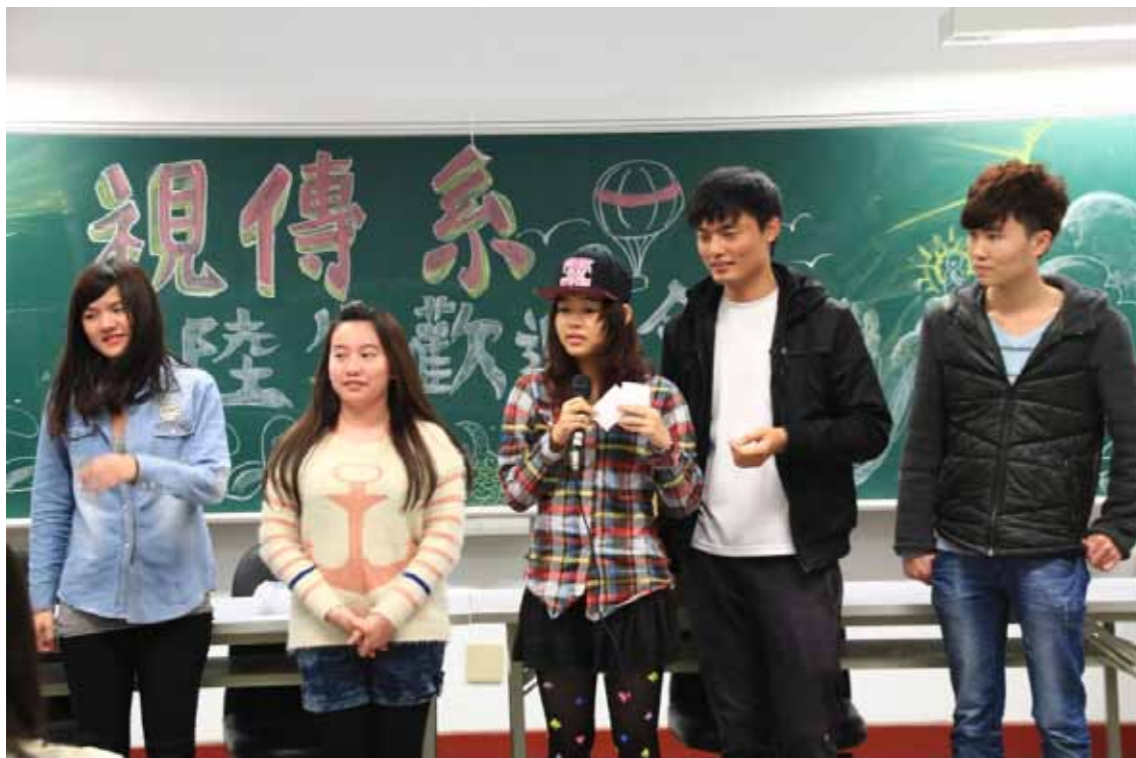
●許多大陸專科畢業生赴海外修習學位，因此開放大陸專科生來臺就讀，能促進技職校院招生來源多元化、國際化