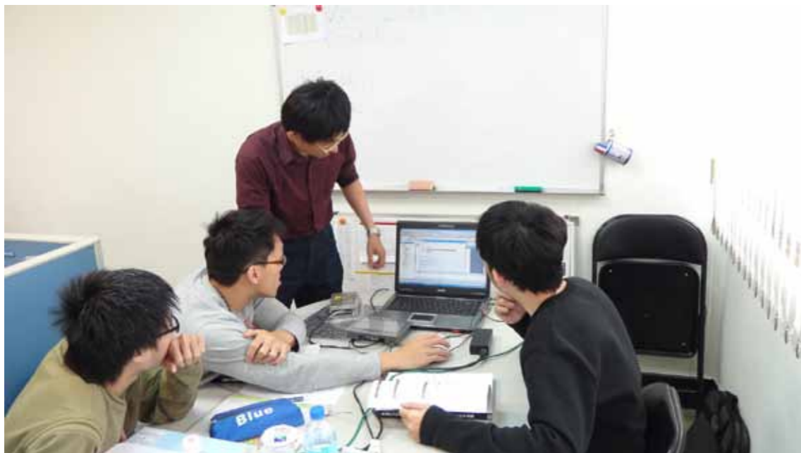
●建議放寬大陸專科學歷的採認，讓大陸專科畢業生依考試成績申請二技入學