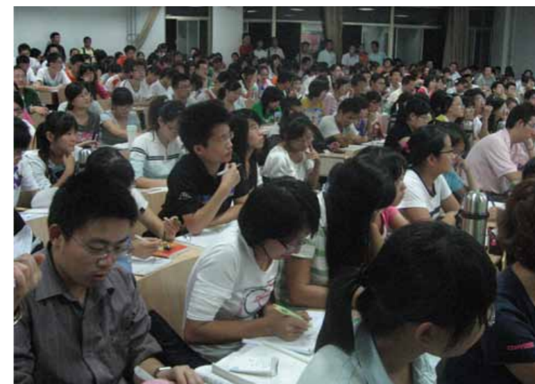
● 招收大陸專科生最好要在 5 月中旬前放榜，以便讓未獲錄取者在畢業前還有時間找到企業就業

綜合以上所述，簡章預計在 1 月份即公告，並在 3 月下旬完成報名程序，5 月中旬放榜。依此規劃的招生時程，勢必無法限制只有參加大陸地區專升本考試的學生才能參加，因此，招生方式將比照現有研究所的招生方式，採取書面審查。學生將各校系組所須審查的書面資料（如自傳、證照、語文能力檢定、競賽獲獎、在校成績等）寄交陸生聯招會後，再由陸生聯招會彙整後轉送各校審查。因係採書面審查，