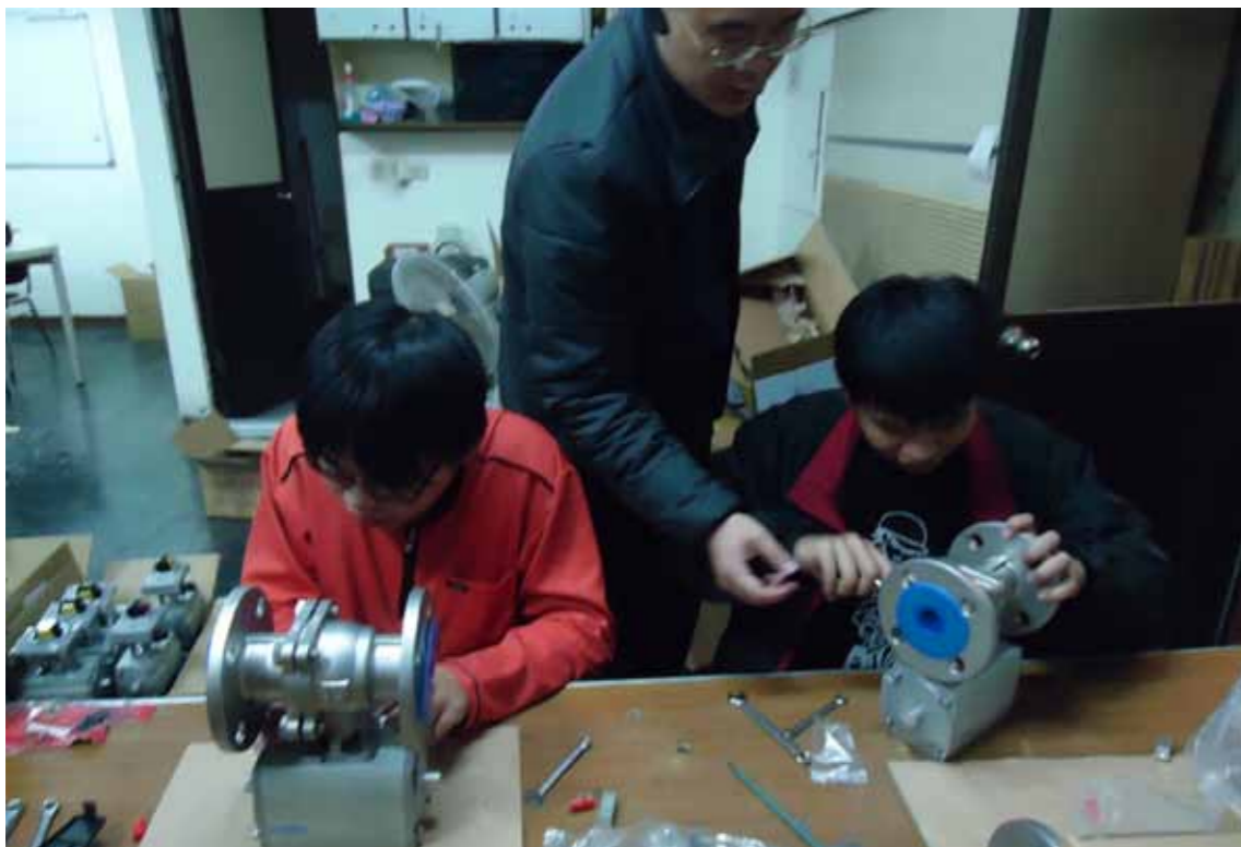
●臺灣的科技校院被誤認為等同於大陸的專科學校，無法授予學士學位，因此無法獲得陸生的青睞