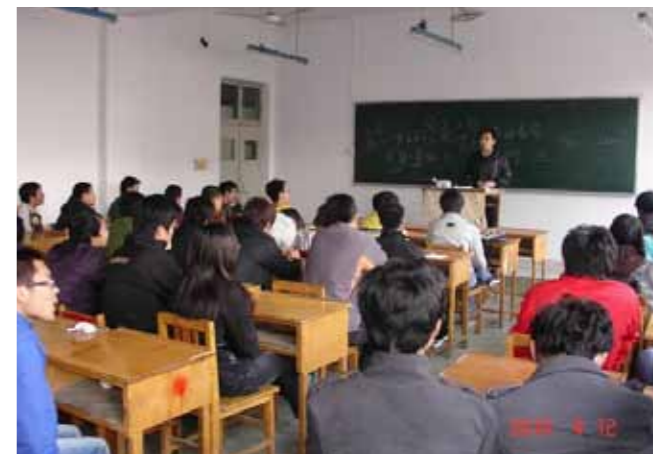
●今年 4 月，教育部公告可以招收大陸專科畢業生來臺就讀二技，也就是開放了所謂的「專升本」

談到大陸專科生來臺就讀二年制學士班課程的安排，技職司張惠雯科長指出目前學校對境外生的教學模式，不外乎專班或混合班上課，招收專科生也不例外，教育部在實施前就曾經探詢過參與招生的學校，很多學校早就沒有開設二年制學士班，想招收二年制學士班生，必須規劃一套完整的二年制課程，學分必須和本地生一樣，都得取得 72 學分，才能畢業，課程是陸生專班或混合班都行，一般而言，若學校本身有二年制學士班課程的，都會採取隨班附讀的混合班規劃，若沒有二年制學士班課程的，就會以專班方式處理，教育部並無限制。