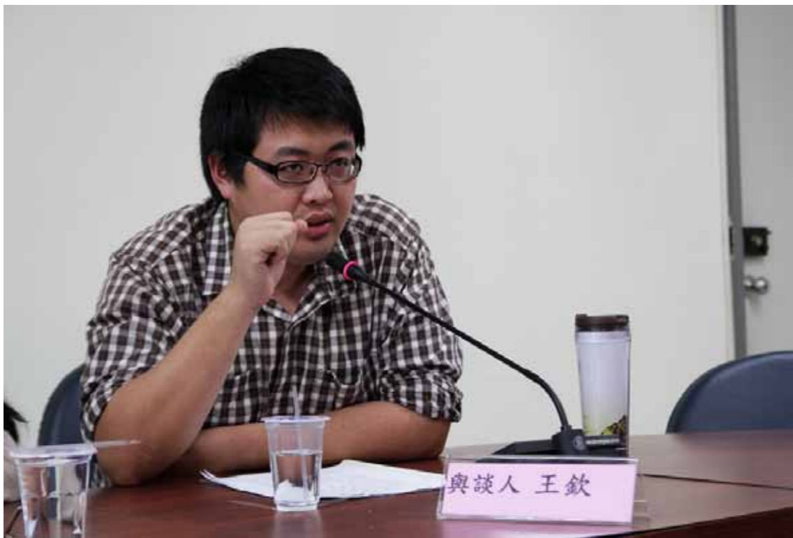
●瑪吉斯學院的成立創造了雙向式的產學合作模式