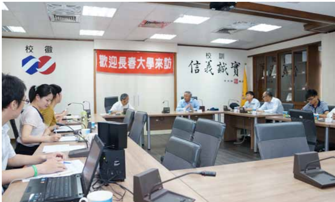
●大陸對臺灣職業校院不了解，以為臺灣職業校院與他們的專科一樣