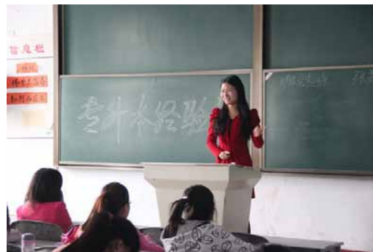
●越來越多大陸當地企業要求員工需具有學士學位，所以專科畢業生尋求更多就讀大學的機會

大陸地區社會對高層次人才的需求不斷增長，一些當地用人部門對員工提出了限期達到學士學位的要求，所以越來越多的專科畢業生尋求提高學位。專升本的類別分為統招專升本（普通高校專升本）和社會成人教育專升本。