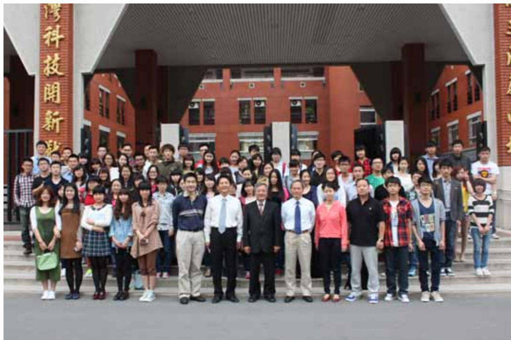
●擴大採認學歷也有助於招收陸生

生 286 萬為多。因大陸地區限制各地專科生升大學本科之招生規模在當年應屆畢業生的 5% 以內，使得大陸專科畢業生升學遇到困境，因此，許多專科畢業生赴海外修習學位。而臺灣技職教育素享盛名，優質且完整，兩岸文化、語言相通，如開放大陸專科生來臺就讀，不僅能宣揚臺灣技職教育之「務實致用」及「符合產業需要」導向，業界師資協同教學縮短學用落差、在校生校外實習、教學設施齊全等特色，同時也促進國內技職院校招生來源多元化，提升我技職校院的影響力。